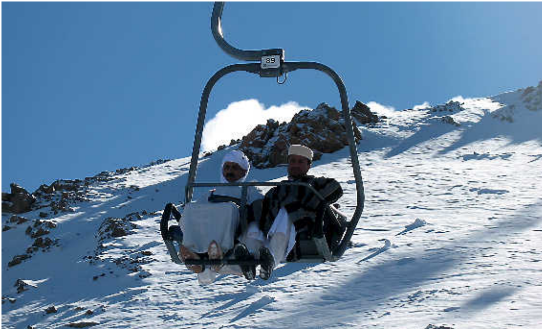
In traditionele kaftan op weg naar boven in Oukaïmeden.

Er zijn veel jongens en mannen die je willen gidsen naar de enige originele Berbermarkt met leren spulletjes en tapijten, of naar de speciale winkel van hun broer, oom of neef. Het is de klassieke manier om verwaald te raken en om van je