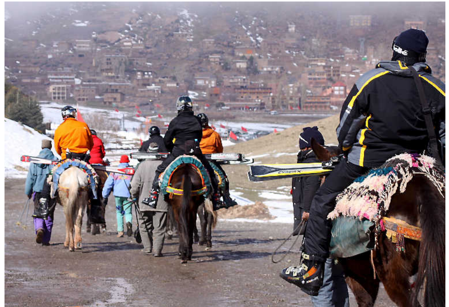
'Berbertaxi's' brengen skiërs van en naar de piste.

Marrakech is bekend van de vele resorts, golfbanen, villa's, spa's en andere vakantieprojecten. Ze verrijzen zomaar in woonwijken, tussen de lemen hutten, aan onafgelegen wegen. Achter de omheining is alles perfect voor elkaar. Azuurblauwe zwembaden, bloemenpracht,