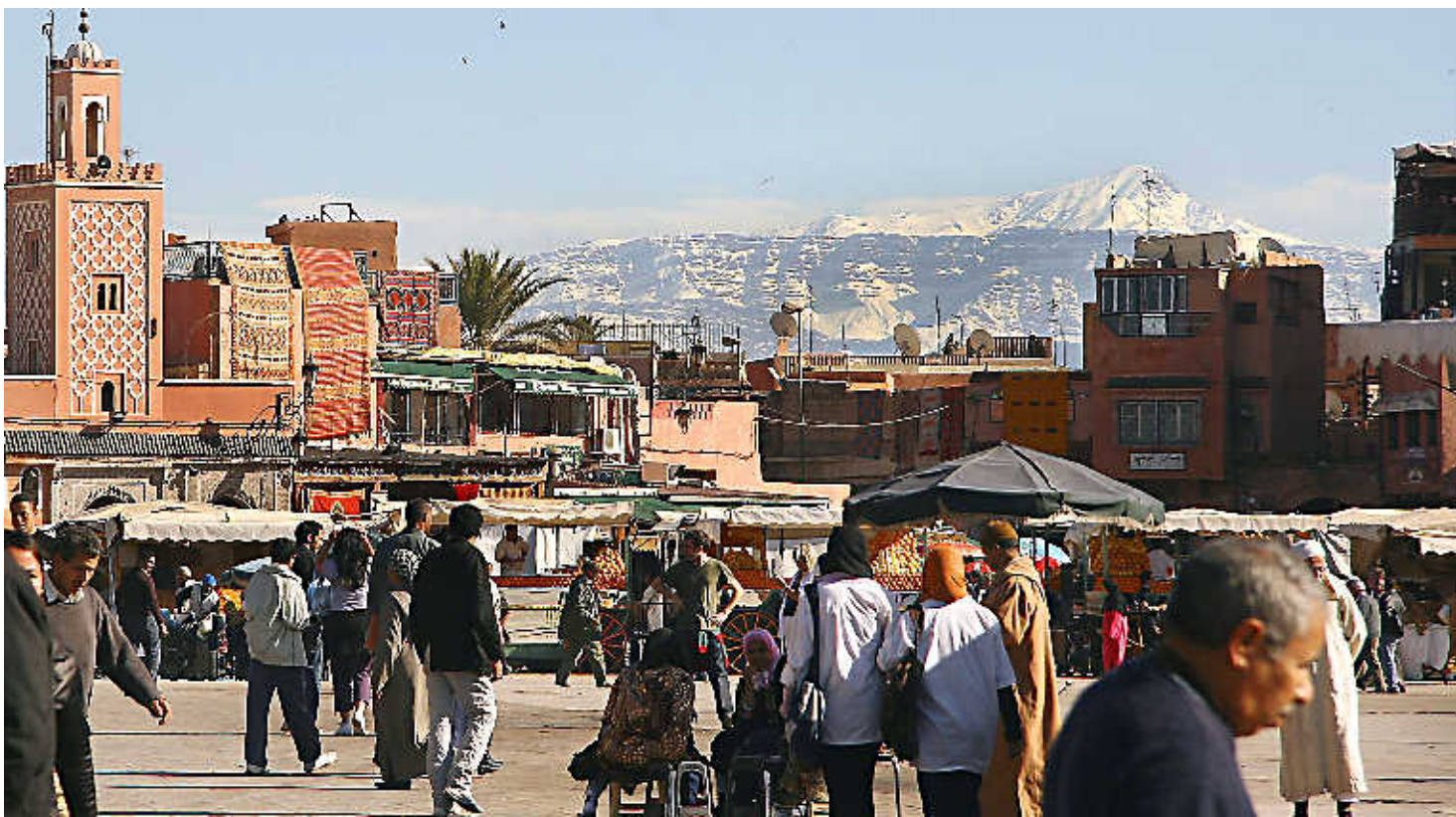
Marrakech met op de achtergrond het Atlasgebergte.