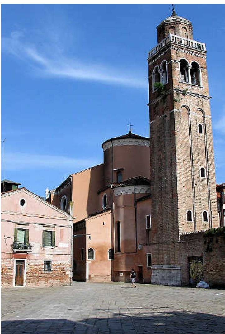
Venetië, een doolhof van steeds stiller en smaller wordende straatjes.